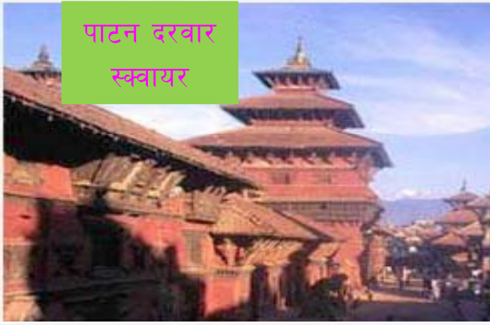
पाटन दरवार स्वयाम